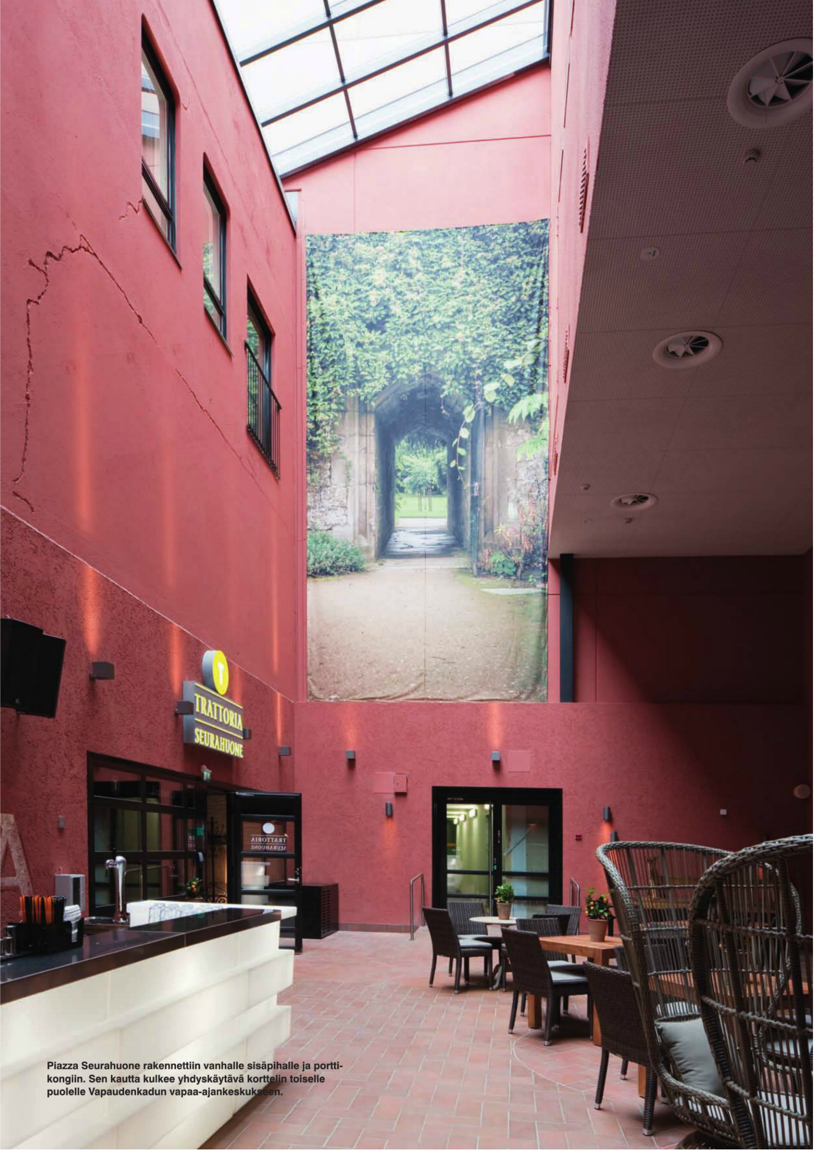
Piazza Seurahuone rakennettiin vanhalle sisäpihalle ja porttikongiin. Sen kautta kulkee yhdyskäytävä korttelin toiselle puolelle Vapaudenkadun vapaa-ajankeskukseseen.