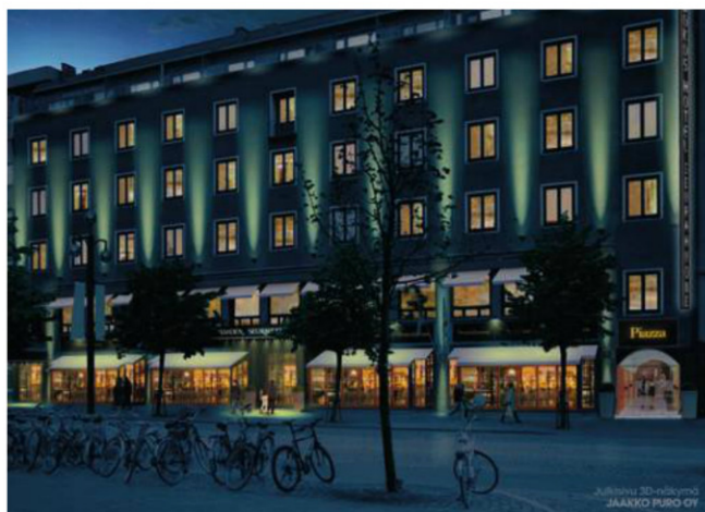
KUVA: JAAKKO PURO OY

TEKSTI: LEENA HUOVILA KUVAT: VOITTO NIEMELÄ