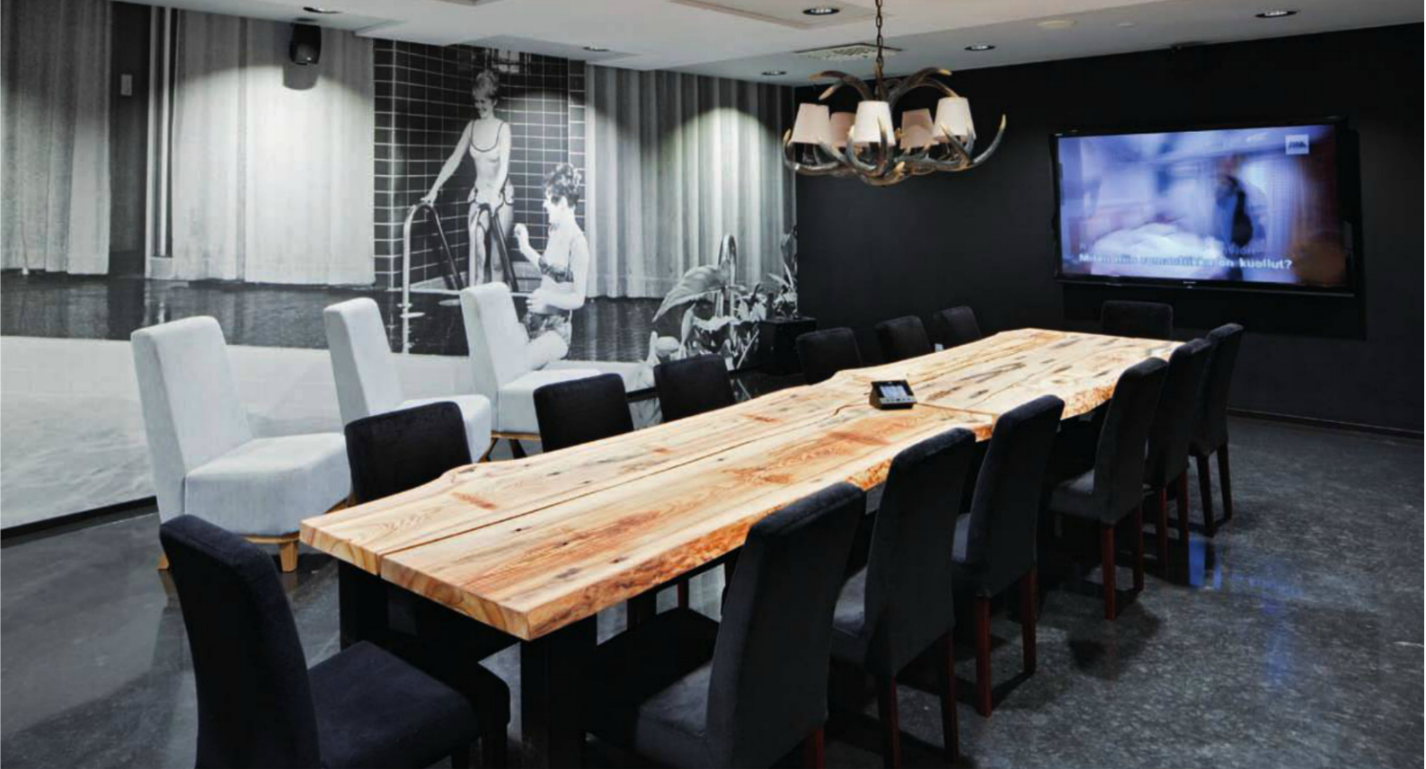
Laune-kabinetti sijaitsee saunan yhteydessä kellarikerroksessa. Hotellihuoneet ovat tasokkaita ja moderneja. Niissä on myös ripaus graafista ja eleganttia art deco -henkeä rakennuksen nuoruusvuosilta.